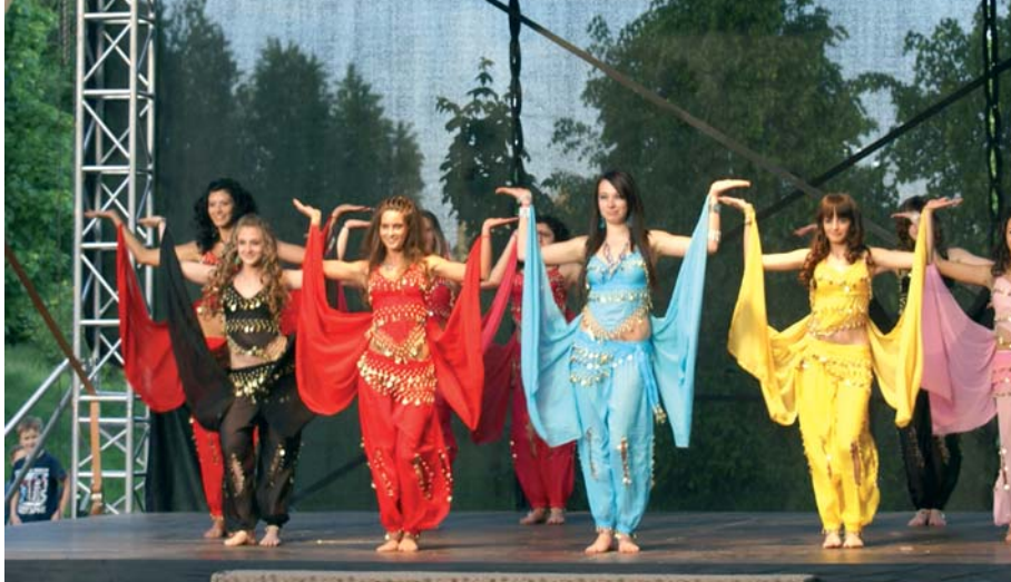
Įvairių tautybių vaikų koncertiniai pasirodymai

Šį rugsėjį savo gyvavimo 25-metį švęs sostinės „Saulėtekio“ (buvusi 58-oji) vidurinė mokykla.